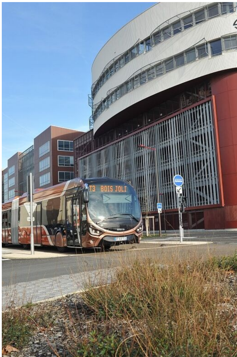
Tempo, bus à haut niveau de service.

Pour des déplacements d'un département à un autre dans les Pays de la Loire, vous pouvez préparer votre voyage sur internet .