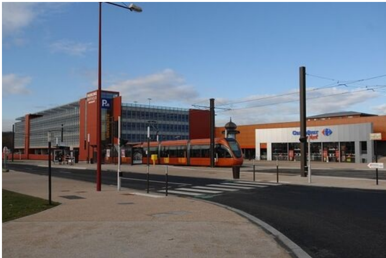
Le parking-relais à l'entrée nord-ouest du Mans.

Pour rejoindre le centre-ville en tramway ou en bus, vous pouvez laisser votre véhicule dans l'un des deux parkings-relais aux entrées de ville.