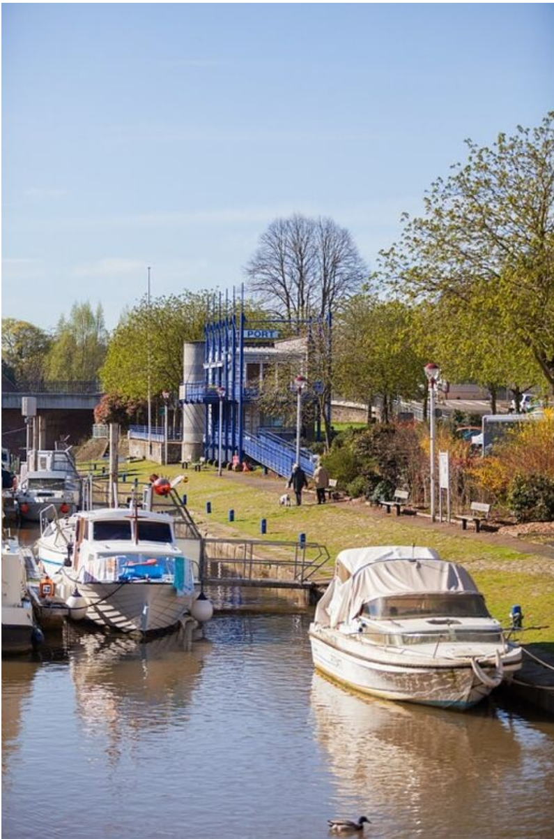
Un amarrage à deux pas du centre-ville.