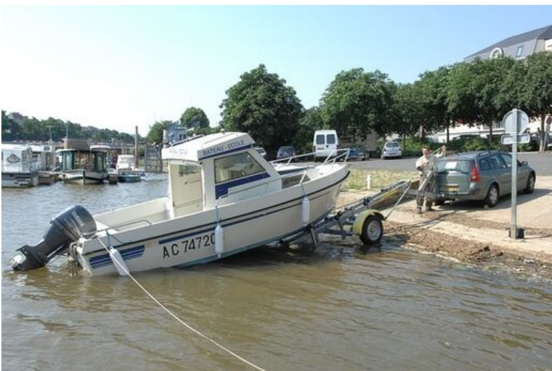
Mise à l'eau du bateau-école La Loubine.

L'école de navigation Hisse et eaux dispense à la capitainerie une formation au permis bateau. D'une durée de 12 heures, elle prépare aux titres de conduite rivière et mer .