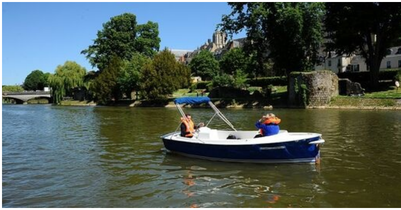
Les bateaux disposent de cinq ou sept places.

Un service de location de bateaux électriques basé à la capitainerie du port vous permet de naviguer sur la Sarthe.